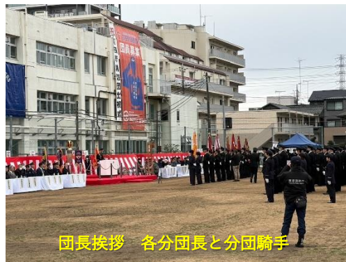
団長挨拶 各分団長と分団騎手