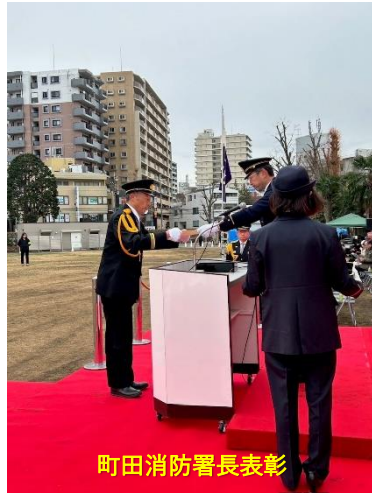
町田消防署長表彰

令和7年1月12日(日) 9:00~11:45、町田市消防団出初式が町田シバヒロにて開催されました。救助演習・一斉放水のほか、10:45からは体験・展示イベントも実施されました。また、鶴川地区担当の第三分団は町田消防署長表彰を受けました。